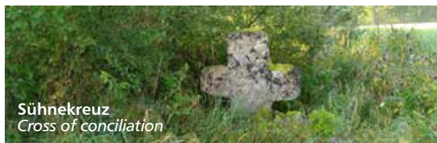
Sühnekreuz Cross of conciliation

Below the Albhalle, follow the marked course of the Klifflinie westwards. After the construction area „Feldle“ shortly south and right again westward follow the hedge-bounded dirt road. Turn right into the forest, uphill and at the height straight through the forest area Längenwinkel up to the meadows at the „Horn“. The dirt road further down the valley, past the „Schlossberg“, to the asphalted community road Zähringen - Weidenstetten. Cross directly; follow the marked Way of St. James (mussel or yellow fork) on an ascending path through the meadow and the forest on Hungerberg and into Zähringen. From Zähringen about 300 m along the road to Altheim (Alb). Then left the Albvereinsweg following (yellow fork) in the valley of Hirschtal. Cross road and uphill on forest road. Again change the side of the road, past the sports facilities on the outskirts of Altheim (Alb). The Zähringer Weg down and over to the parking lot at the Albhalle.