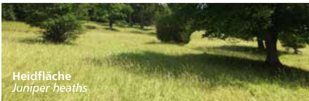
Heidfläche Juniper heaths

Cross the L 1165 and first along the paved road eastward through the Hungerbrunnental to the karst spring. After the spring, continue for about 100 m and then switch to the southern side of the valley and along the edge of the forest about 100 m up the valley. Turn left into the forest, first steep uphill (often wet) south, and later in a southwest direction through the Banholz. After leaving the forest along the forest trail northwest into the nature reserve Hungerbrunnental. Keep the direction on a meadow path through the reserve down the valley. At the bottom of the asphalt road back to the parking lot.