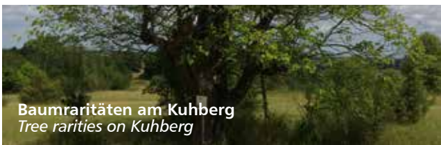
Baumraritäten am Kuhberg Tree rarities on Kuhberg